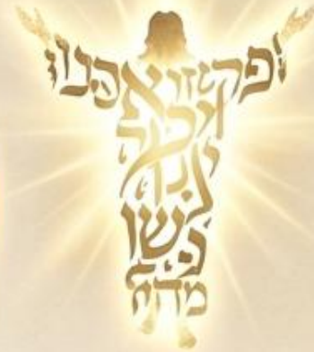
La Palabra Encarnada (Yeshúa)

AL ELOHIM DE NUESTRO ADÓN YESHÚA,[...]QUE LES DÉ EL RUAJ DE SABIDURÍA Y REVELACIÓN, PARA[...]TENER PLENO CONOCIMIENTO DE EL. EFESIOS 1:17