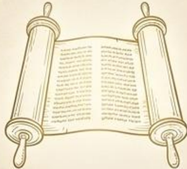
La Palabra Escrita (Toráh)

SI ALGUNO ESTÁ FALTO DE SABIDURÍA, PIDA A YAHWEH, EL LE DA A TODOS LOS HOMBRES GENEROSAMENTE Y SIN REPROCHE... SANTIAGO 1:5