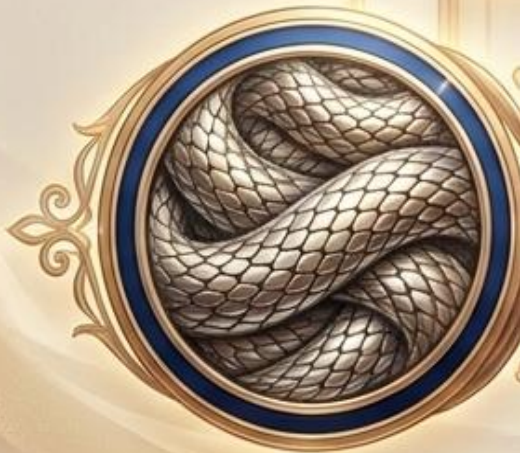
Serpiente / Najásh (Strong #5175)

Raíz primitiva: sisear, susurrar un conjuro, adivinar, encantamiento.