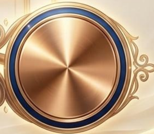
Bronce / Nejóshet (Strong #5178)